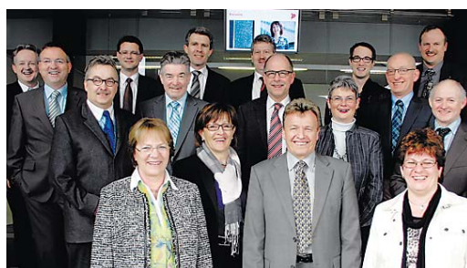
Collaborazione positiva tra i vertici.