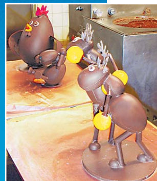
Renne e gallo da Pascal: omaggio alle origini e alla seconda patria.