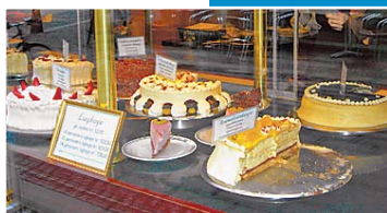
Vetrina di pasticceria danese: ma chi si preoccupa della linea?