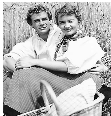
H. Schmidhauser e L. Pulver.