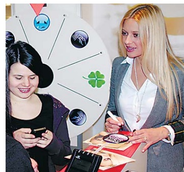
Christa Rigozzi, in occasione della presenza alla FBK 2011.

Durante la sua molto notata presenza alla FBK, Christa Rigozzi - Miss Svizzera 2006 - ha palesato particolare interesse verso il nostro settore professionale. «La passione per il pane e il cioccolato mi spinge a voler mettere davvero le mani in pasta, e a vivere da vicino un'esperienza in pasticceria o in confetteria - dice Christa - che poi aggiunge: Confesso subito che poi non mi risparmierei a degustare quello che sarò riuscita a fare».